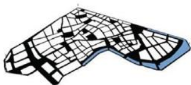
زیرساخت‌ها و فضاهای شهری